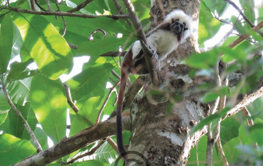
Nombre común: Tití, tití cabeza blanca Nombre científico: Saguinus oedipus

Es un primate pequeño, de color marrón en el dorso, las patas y el pecho son blancos y posee una característica melena blanca. Conforman parejas y grupos entre 4 y 8 individuos, se alimenta de frutos, insectos, flores y resinas de los árboles. Es una especie que solo existe en parte de la región Caribe de Colombia. Se encuentra amenazada de extinción en la categoría de Peligro Crítico (CR) debido a la alta transformación de sus hábitats y al uso como mascota. Se encuentra en la región de San Onofre y en la región de Puerto Libertador.