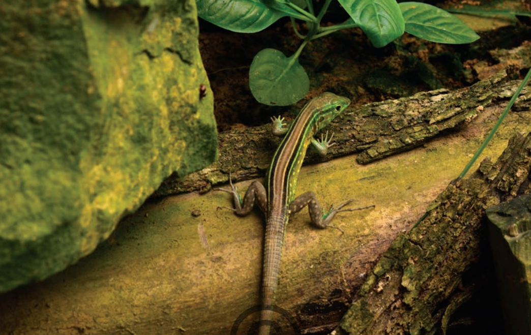
Nombre común: Lagartija, lobito Nombre científico: Cnemidophorus lemniscatus

Esta lagartija de tamaño mediano se puede diferenciar de otras gracias a su patrón de coloración que incluye líneas cafés, negras, verdes y amarillas, en los machos más grandes se puede presentar una coloración azul en la zona de la garganta. Estos animales suelen alimentarse de cualquier insecto que se encuentre en su territorio, como hormigas, cucarachas, polillas y cucarrones. Habita principalmente en cercanías a diferentes construcciones, al borde de caminos y raramente en bosques. Especie común en Puerto Libertador y en San Onofre.