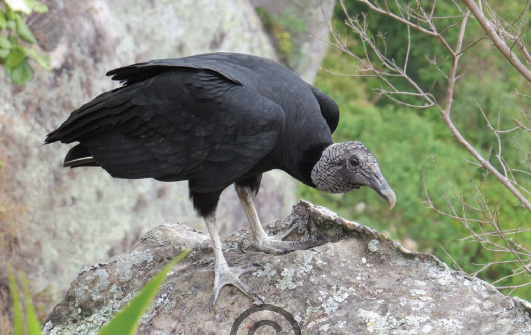
Nombre común: Gallinazo común, chulo Nombre científico: Coragyps atratus

Es un gallinazo de color negro que se encuentra muy relacionado con actividades humanas, se alimenta de carroña en una gran variedad de hábitats, en especial a lo largo de ríos y campos abiertos, casi nunca en áreas boscosas. Tiene dormitorios comunales donde se diferencian grupos con estructuras sociales que salen juntos en búsqueda de alimento. Dependen de las corrientes de aire para levantar vuelo a gran altura. Está presente en las zonas de San Onofre y Puerto Libertador.