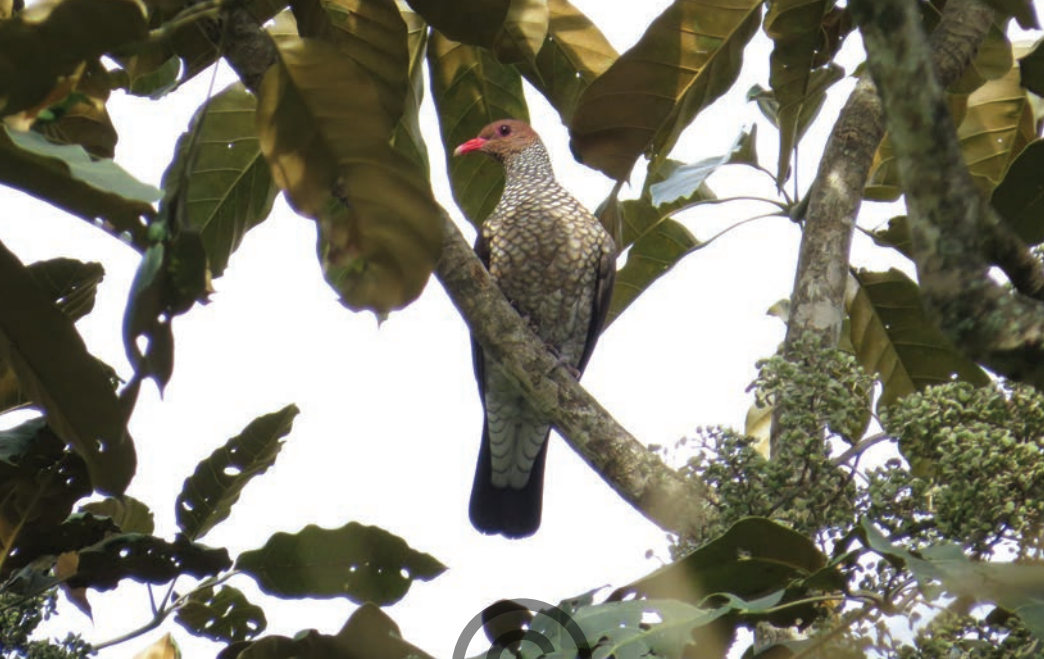
Nombre común: Torcaza escamada Nombre científico: Patagioenas speciosa

Esta especie de paloma se encuentra en bosques húmedos, bordes de bosque, claros con árboles altos, sabanas con árboles dispersos y bosques de galería. Se le observa consumiendo pequeños frutos y plantas. Generalmente permanece en la parte más alta del bosque, en ocasiones sola o en parejas, pero se le observa en bandadas de hasta 100 individuos. Está presente en la zona de Puerto Libertador.