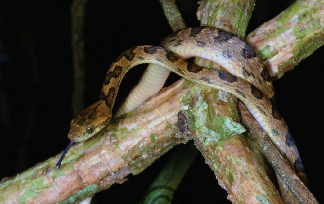
Nombre común: Falsa mapaná Nombre científico: Leptodeira septentrionalis

Esta inofensiva serpiente es fácilmente confundida con una víbora, sin embargo, su cabeza tiene solo nueve escamas grandes, además, las escamas del cuerpo presentan un acabado brillante con escamas lisas, la coloración del dorso incluyen parches negros de diferentes formas y en un solo tono. Esta especie consume principalmente ranas y lagartijas, aunque puede comer otro tipo de vertebrados. Esta especie fue vista en los municipios de Puerto Libertador y San Onofre.