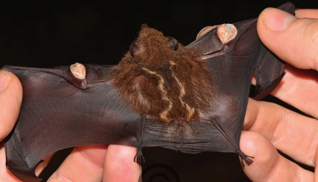
Nombre común: Murciélago de líneas Nombre científico: Saccopteryx leptura

Es una especie pequeña, de color café con dos líneas onduladas blanquecinas en el dorso. El labio superior es más largo que el inferior dando una apariencia de una pequeña trompa. La membrana entre las piernas es larga con la cual se ayuda para capturar insectos de los que se alimenta. Los machos tienen unos pequeños sacos en las alas donde se produce un olor particular para atraer a las hembras. Suele descansar posado en el tronco de los árboles, en casas o bajo puentes y alcantarillas. Se encuentra en las regiones de Puerto Libertador y de San Onofre.