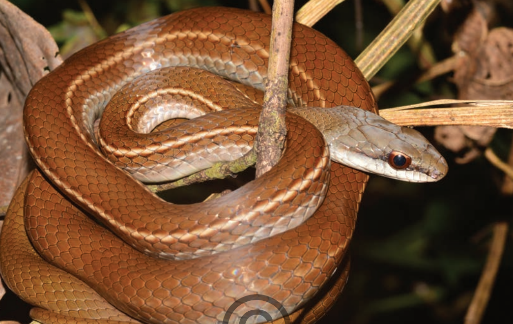
Nombre común: Azotadora, cazadora café Nombre científico: Mastigodryas pleei

— — Esta serpiente se puede diferenciar de otras por poseer una serie de bandas cafés, negras y blancas a lo largo del cuerpo que en la parte posterior se fusionan para hacer bandas más gruesas, la cara presenta una banda blanca en la región del mentón que se extiende por todo el vientre. Esta especie se alimenta de cualquier vertebrado que pueda atrapar, entre ellos ranas, lagartijas, aves y roedores. Esta especie fue avistada en el municipio de San Onofre.