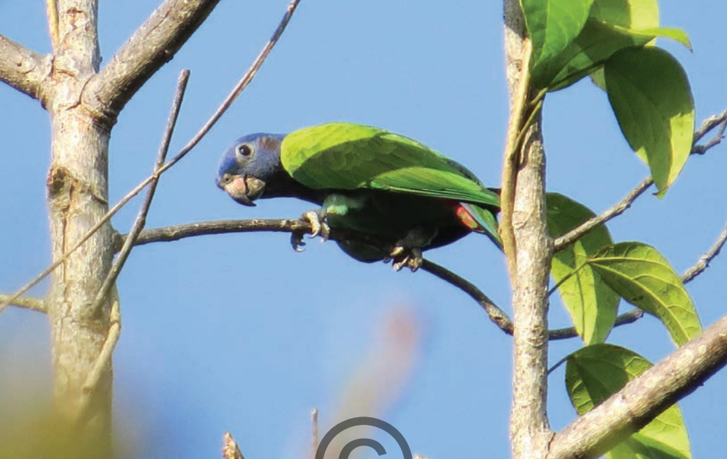
Nombre común: Cotorra cabeciazul Nombre científico: Pionus menstruus

Esta especie de loro se encuentra en diferentes tipos de bosques, también en plantaciones y áreas semiabiertas con árboles dispersos o palmas. Su alimentación se compone principalmente de semillas, flores, brotes y frutos de maíz, papaya y palmas. Anida en agujeros en trozos de tallos de palma seca o en troncos vivos. Está presente en las zonas de San Onofre y Puerto Libertador.