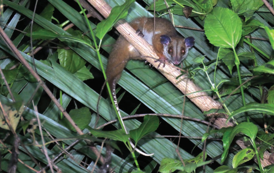
Nombre común: Leoncillo, zorra mantequera Nombre científico: Caluromys lanatus

Es un marsupial mediano (30 cm aproximadamente más la longitud de la cola). En los marsupiales el desarrollo de las crías finaliza en el marsupio (una bolsa de piel en el vientre). El lomo es marrón rojizo y el vientre es amarillento claro; posee en medio de los ojos una raya oscura hasta la nariz; las orejas son de color café oscuro. La cola puede enroscarse para agarrarse de ramas. Es nocturna, solitaria y arborícola; se alimenta de frutas, insectos y otros invertebrados, en época seca liba el néctar de las flores. Se encuentra en la región de Puerto Libertador y de San Onofre.