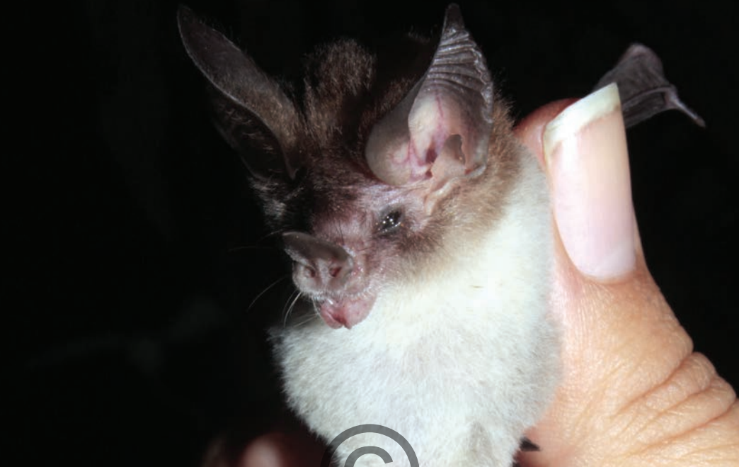
Nombre común: Murciélago de vientre blanco Nombre científico: Micronycteris minuta

Es un murciélago pequeño, de color rojizo o marrón en el dorso y blanco a amarillento claro en el vientre. Posee una hoja nasal (una prolongación de la nariz en forma de punta de lanza que le ayuda a direccionar sonidos para ecolocalizar). Sus orejas son grandes y redondeadas. La membrana caudal es amplia y larga la cual le permite atrapar insectos de los cuales se alimenta. También consume frutos. Se refugian en troncos huecos, raíces y cuevas. Se encuentra en la región de Puerto Libertador y posiblemente en el municipio de San Onofre.