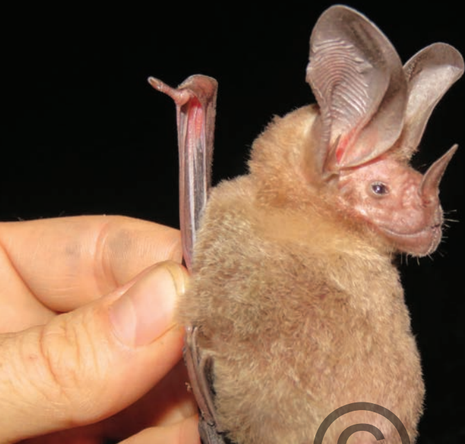
Nombre común: Murciélago de orejas redondas Nombre científico: Lophostoma silvicolum

Es un murciélago grande, su color es café-grisáceo. Posee una hoja nasal (una prolongación de la nariz en forma de punta de lanza que le ayuda a direccionar sonidos para ecolocalizar). Las orejas son grandes y redondeadas, con numerosos pliegues en su interior. Se alimenta principalmente de insectos, pero puede consumir frutos del bosque y pequeños vertebrados. Se refugian en árboles huecos y termiteros. Se encuentra en la región de Puerto Libertador.