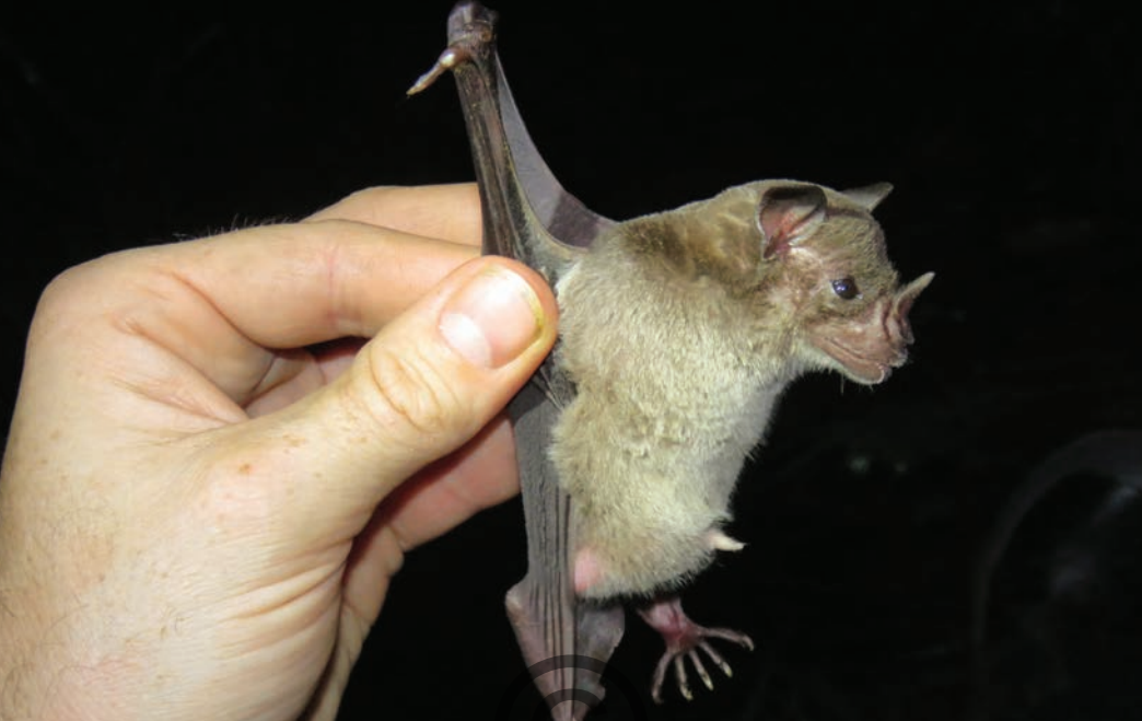
Nombre común: Murciélago bicolor Nombre científico: Phyllostomus discolor

Es un murciélago grande. Posee una hoja nasal (una prolongación de la nariz en forma de punta de lanza que le ayuda a direccionar sonidos para ecolocalizar). Sus ojos son grandes. El dorso es negruzco a marrón y el vientre es pálido. Se alimenta de frutos, insectos grandes así como de polen y néctar, es decir que es un dispersor de semillas y un polinizador de varias especies vegetales. Conforman grupos numerosos. Se encuentra en las regiones de Puerto Libertador y de San Onofre.