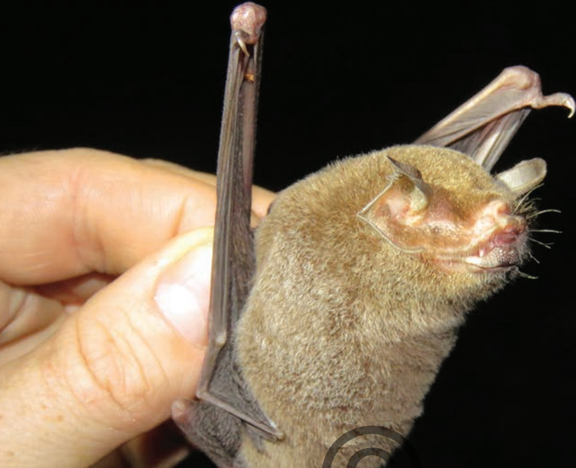
Nombre común: Murciélago bigotudo Nombre científico: Pteronotus parnellii

Es una especie mediana de color café anaranjado. Sus orejas aunque son cortas, rodean los ojos. Los labios son anchos y con pliegues. Tiene largos pelos sensoriales alrededor de la boca que le sirven para detectar los insectos de los que se alimenta. Es un importante controlador de insectos plaga. Se refugia en cuevas y grietas. Se encuentra en la región del Puerto Libertador.