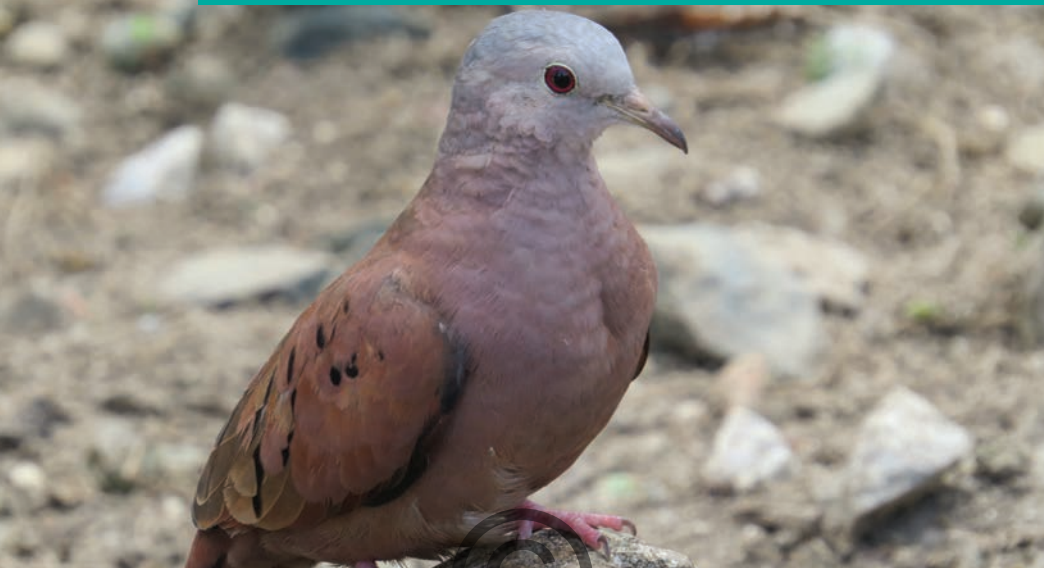
Nombre común: Tortolita común Nombre científico: Columbina talpacoti

Es una especie de paloma pequeña, común en terrenos abiertos, campos, granjas, prados, jardines, bordes de bosque y en zonas urbanas. Su alimentación consta principalmente de semillas que busca en el suelo. Se observa solitaria, en parejas o en grupos de tamaño variable. Vuela a corta distancia, su vuelo es rápido y directo. Está presente en las zonas de San Onofre y Puerto Libertador.