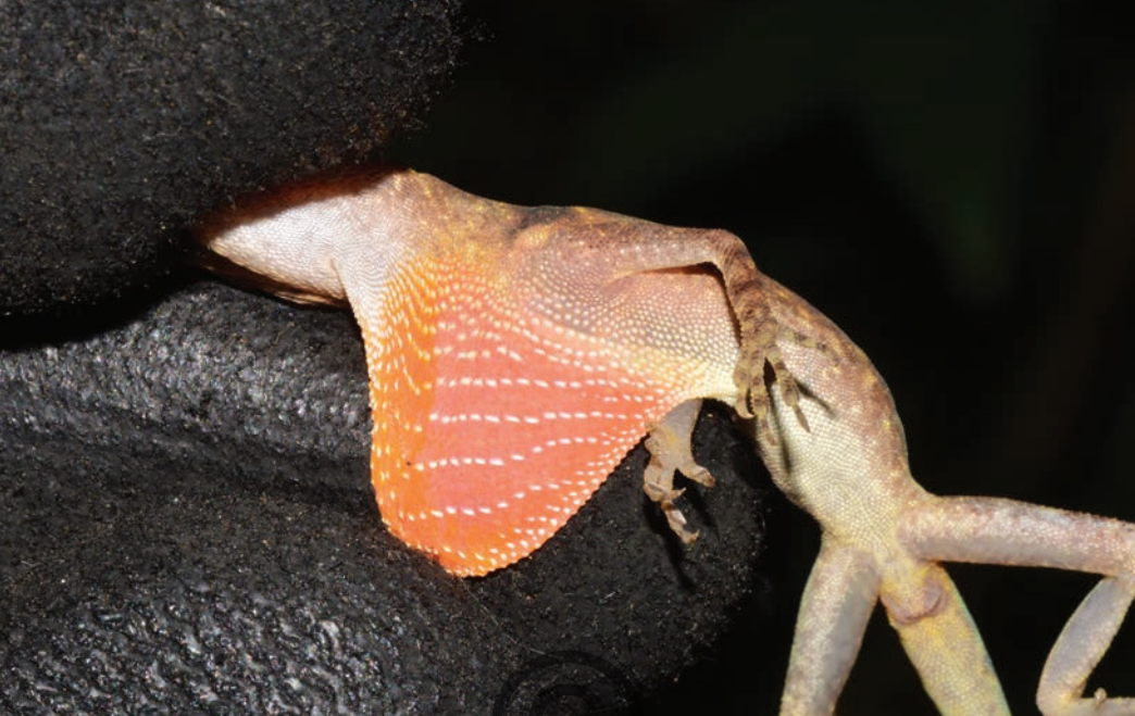
Nombre común: Lagartija, abaniquillo, lobito Nombre científico: Anolis tropidogaster

Esta pequeña lagartija puede diferenciarse de otras especies similares por el abanico de la garganta que posee un color rojo uniforme con pequeñas escamas de color café o negro, esta coloración solo la presentan los machos. Estos animales suelen encontrarse en los bordes de los bosques donde busca activamente pequeños insectos para alimentarse, motivo por el cual se considera fauna controladora de potenciales plagas. Esta especie se puede ver en Puerto Libertador y en San Onofre.