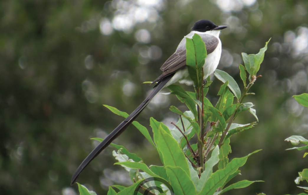
Nombre común: Sirirí tije , sirirí tije Nombre científico: Tyrannus savana

Es una especie de atrapamoscas que habita terreno abierto y claros especialmente pastos y sabanas con arbustos o árboles dispersos, en áreas boscosas se encuentra cerca de ríos. En Colombia se encuentran poblaciones residentes y migratorias provenientes del sur del continente. Se observa solitaria o en bandadas. Los que son migratorios se reúnen en bandadas numerosas de centenares o miles para pasar la noche. Se alimenta de insectos los cuales caza en el aire o en el suelo, también consume frutos. Está presente en las zonas de San Onofre y Puerto Libertador.