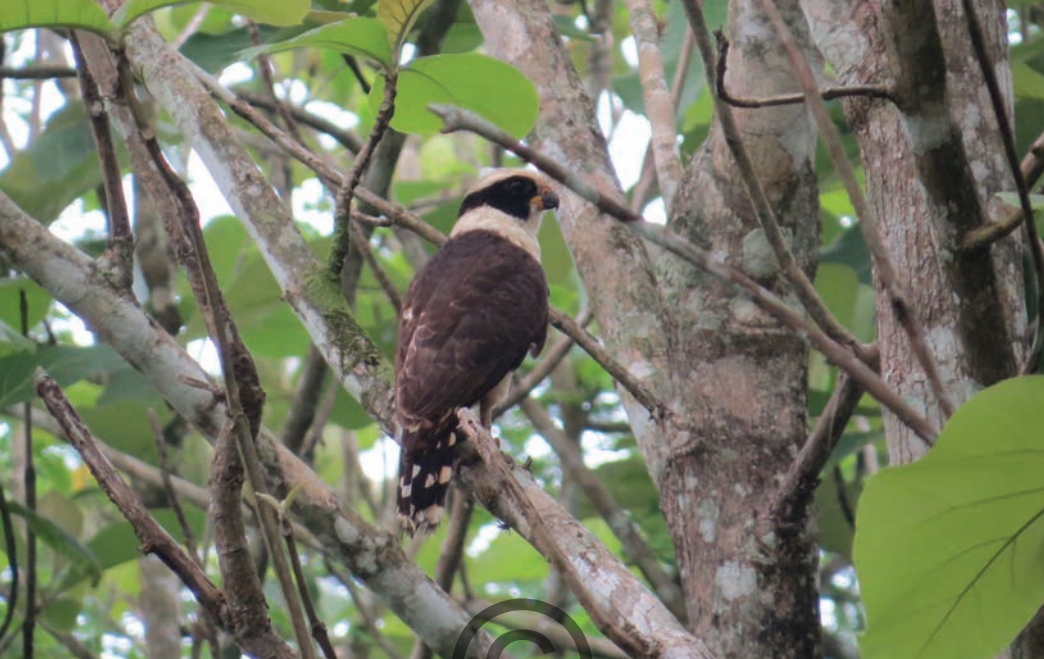
Nombre común: Halcón culebrero, guaco Nombre científico: Herpetotheres cachinnans

Es una especie de halcón mediano y común en borde del bosque, bosque perturbado y abierto, y a lo largo de ríos, principalmente en tierras bajas. Se caracteriza por su antifaz oscuro. Consume serpientes terrestres y arbóreas, como corales, cascabel, mapanás y muchas otras cazadoras; caza en zonas con buena visibilidad. Se posa con la cabeza ligeramente inclinada por largos periodos a la espera de serpientes, las cuales son capturadas con el pico o las patas. Está presente en las zonas de San Onofre y Puerto Libertador.