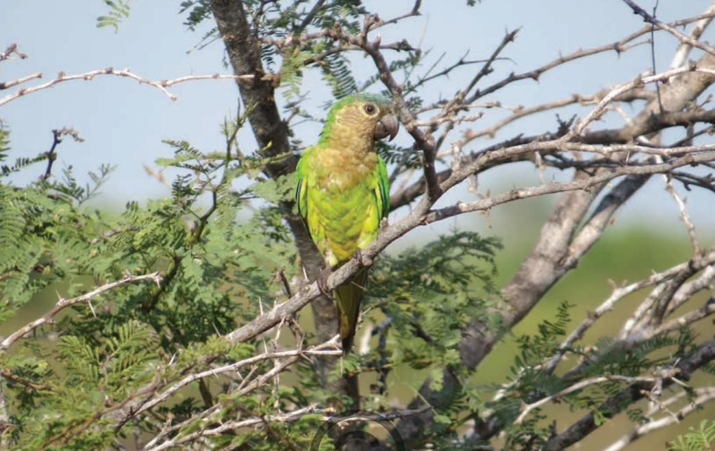
Nombre común: Perico carisucio Nombre científico: Eupsittula pertinax

Esta especie de loro es común en sabanas y zonas áridas, en matorrales, áreas semiabiertas en manglares, bordes de bosque, áreas cultivadas y palmas. Su dieta se constituye principalmente de plantas, a veces de semillas de cultivos, así como flores y frutos. Se desplaza hacia áreas con mayor humedad en las temporadas secas en la zona de Santa Marta. Está presente en las zonas de San Onofre y Puerto Libertador.