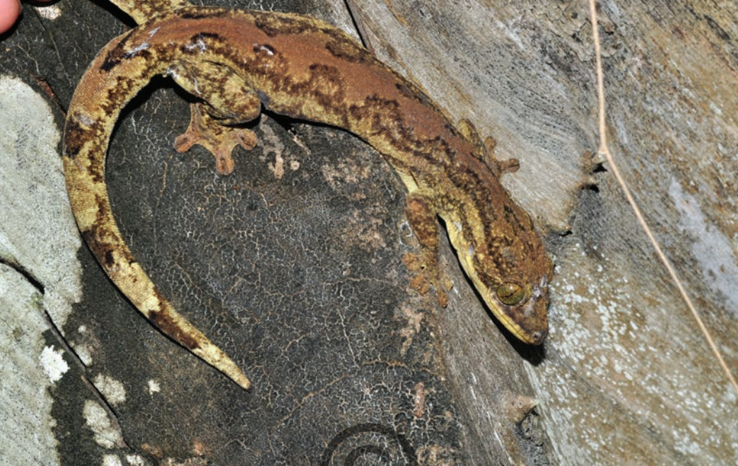
Nombre común: Tuqueca, gecko gigante Nombre científico: Thecadactylus rapicauda

Este es el gecko más grande que se puede encontrar, puede medir más de 12 cm, esta especie a diferencia de otros geckos nocturnos es encontrado principalmente en el bosque y de forma esporádica en cercanías a las casas. Esta especie es una consumidora de grandes cantidades de insectos, principalmente mariposas, cucarrones y cucarachas que busca activamente en las noches. Esta especie fue vista en el municipio de San Onofre.