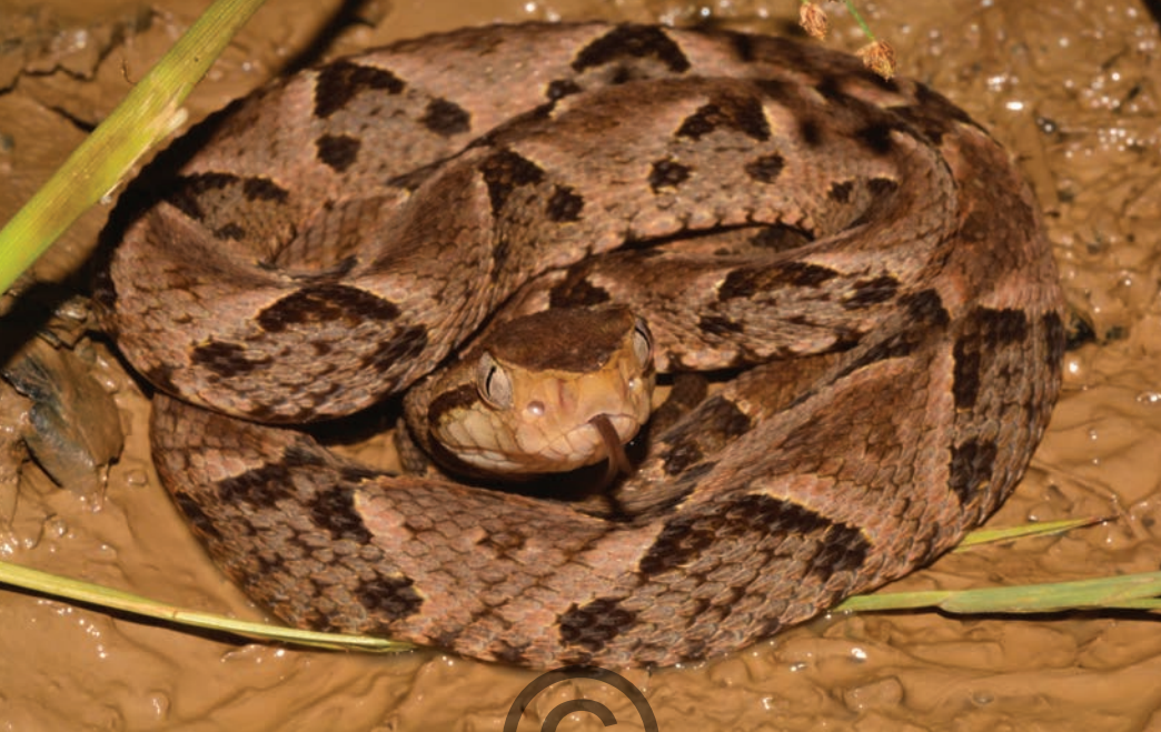
Nombre común: Mapaná, talla X, X, rabiseca, cabeza de candado, cuatro narices Nombre científico: Bothrops asper

Esta especie se puede diferenciar de otras ya que presenta una coloración café con un patrón dorsal que forman X o diamantes, sus escamas se diferencian de otras especies por ser opacas y por presentar una quilla que forma líneas longitudinales. Suele encontrarse en varios hábitats, pero son más comunes donde abundan ratones, ranas y lagartijas. Esta especie es potencialmente letal, su veneno produce hemorragias y daño en los tejidos. Fue vista en Puerto Libertador y en San Onofre.