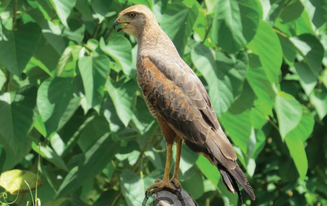
Nombre común: Águila sabanera, bebe humo Nombre científico: Buteogallus meridionalis

Es un águila común de las sabanas tropicales, también en bordes de bosque, bosques cerca de ríos, pantanos y manglares. Se considera una especie oportunista, aprovecha lugares en quema para comer los animales que escapan al fuego; se alimenta de pequeños mamíferos, aves, cangrejos, ranas, lagartijas, serpientes e insectos. Establece un territorio en la mayoría de los casos. Está presente en las zonas de San Onofre y Puerto Libertador.