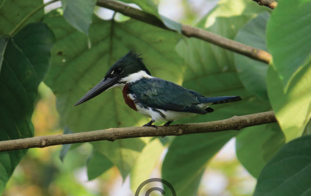
Nombre común: Martín-pescador matraquero Nombre científico: Chloroceryle amazona

Esta especie de martín pescador se encuentra cercano a los bordes de lagos y lagunas con árboles aislados, a veces cerca de lagunas salobres, manglares y canales. Es más común en hábitats abiertos. Su alimentación se compone principalmente de peces y crustáceos. Caza en la mañana y en la tarde, pero a veces también al atardecer; permanece parado mirando hacia el agua o realiza vuelos sobre el agua en búsqueda de presas, y una vez atrapado el pez, se posa y lo traga entero por la cabeza. Está presente en la zona de Puerto Libertador.