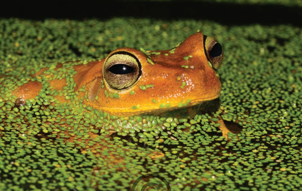
Nombre común: Rana platanera Nombre científico: Boana xerophila

Esta rana, muy similar en forma y tamaño a la especie B. pugnax , se diferencia en la coloración del ojo, puesto que, a diferencia de la otra especie, presenta un color amarillo bordeado por una línea negra. Estas ranas están armadas con espuelas para el combate con individuos de su misma especie. Al igual que especies similares, esta rana es un gran controlador de insectos. Estos animales fueron encontrados en todas las coberturas estudiadas en San Onofre.