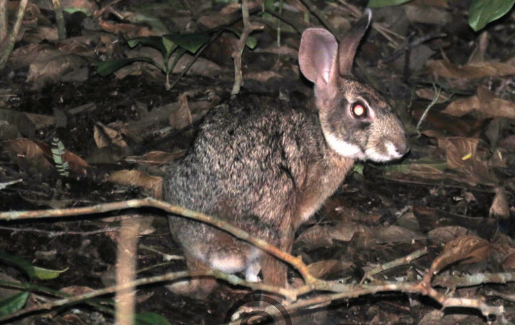
Nombre común: Conejo, conejo sabanero Nombre científico: Sylvilagus floridanus

El conejo sabanero es mediano, pesa alrededor de un kilogramo. Su pelaje es suave, denso y lanoso, de color gris jaspeado con negro. Las orejas con largas y estiradas. La cola es corta y esponjada. Tiene garras en las manos que le permiten excavar madrigueras. Es terrestre y solitaria. Puede estar activo tanto de día como de noche. Es herbívoro, consume hojas, ramas jóvenes y corteza de algunos árboles. Puede ser depredado por tigrillos, zorros guaches y pumas. Pueden existir otra especie de conejo sabanero ( Sylvilagus brasiliensis ), en la regiones de Puerto Libertador y San Onofre pero no se diferencian fácilmente a simple vista.