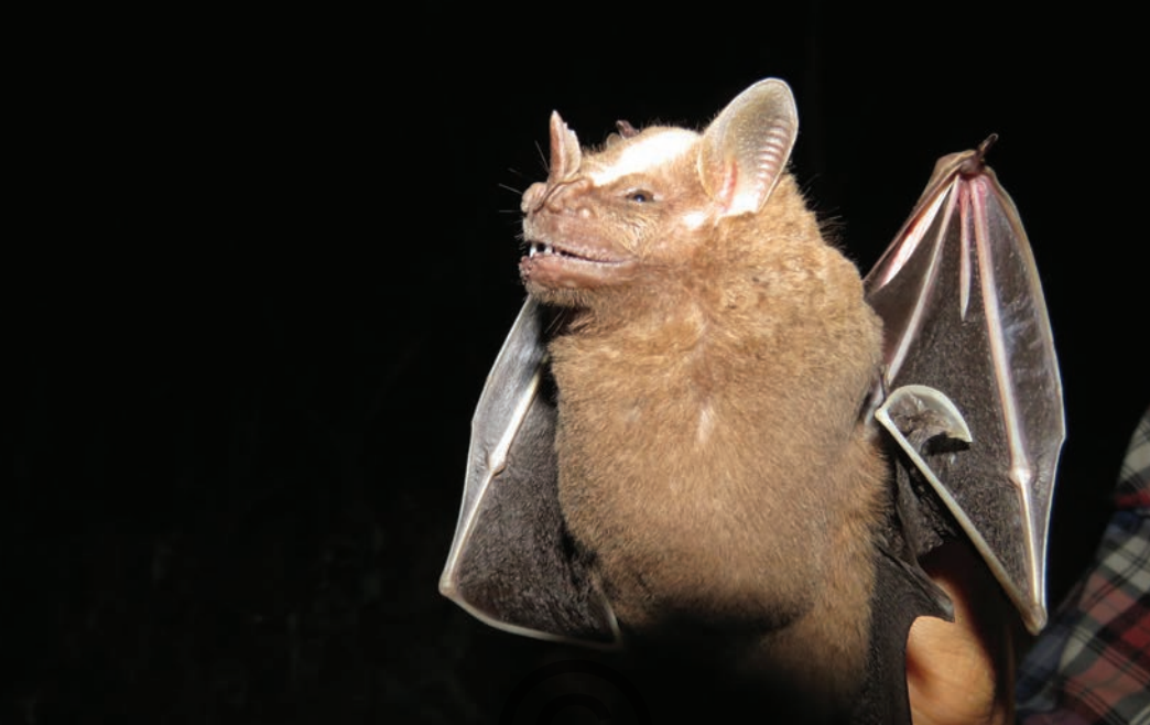
Nombre común: Murciélago frugívoro grande Nombre científico: Artibeus lituratus

Este murciélago frugívoro es grande, de color café oscuro grisáceo, un poco más claro hacia los hombros. Presenta cuatro líneas blancas notorias en el rostro, las superiores más anchas. Posee una hoja nasal (una prolongación de la nariz en forma de punta de lanza que le ayuda a direccionar sonidos para ecolocalizar). Por la longitud y ancho de las alas puede desplazarse largas distancias. Consume muchos frutos de los bosques, incluso de especies cultivadas como mangos y guayabas. Es un importante dispersor de semillas. Se encuentra en la región de Puerto Libertador y San Onofre.