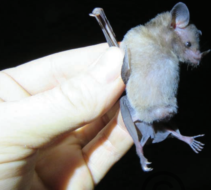
Nombre común: Murciélago trompudo Nombre científico: Glossophaga soricina

Es una especie pequeña de pelaje café oscuro. Su hocico es prolongado y tiene una lengua larga, lo cual le permite llegar al néctar de flores de varias especies vegetales. Posee una hoja nasal (una prolongación de la nariz en forma de punta de lanza que le ayuda a direccionar sonidos para ecolocalizar). El alimentarse de flores hace a esta especie un importante polinizador. También consumen frutos e insectos. Conforman colonias de muchos individuos que descansan en grietas o cuevas. Puede estar en cercanías a caseríos y a cultivos de frutales. Se encuentra en las regiones de Puerto Libertador y de San Onofre.