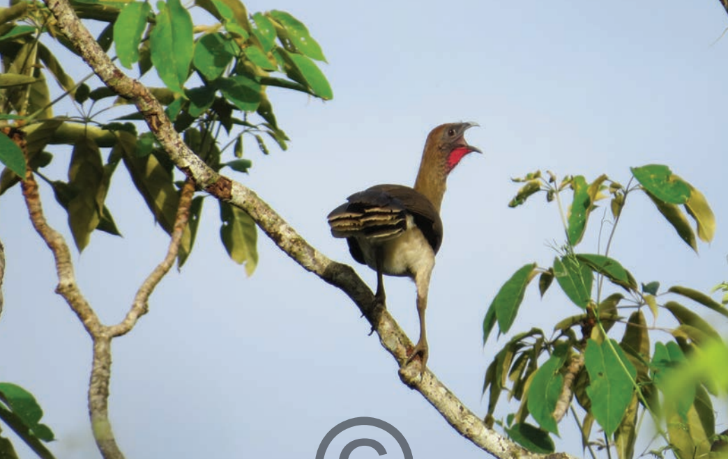
Nombre común: Guacharaca caribeña Nombre científico: Ortalis garrula

Es una especie de guacharaca que se encuentra solo en el norte de Colombia. Es distintiva por su cabeza castaña y vientre blanco. Se encuentra en diferentes tipos de matorrales y bosques. Se alimenta de frutos y a veces de hojas, desplazándose hábilmente por las ramas de los árboles grupos ruidosos de entre 6 y 12 individuos, rara vez baja al suelo a buscar alimento. Está presente en las zonas de San Onofre y Puerto Libertador.