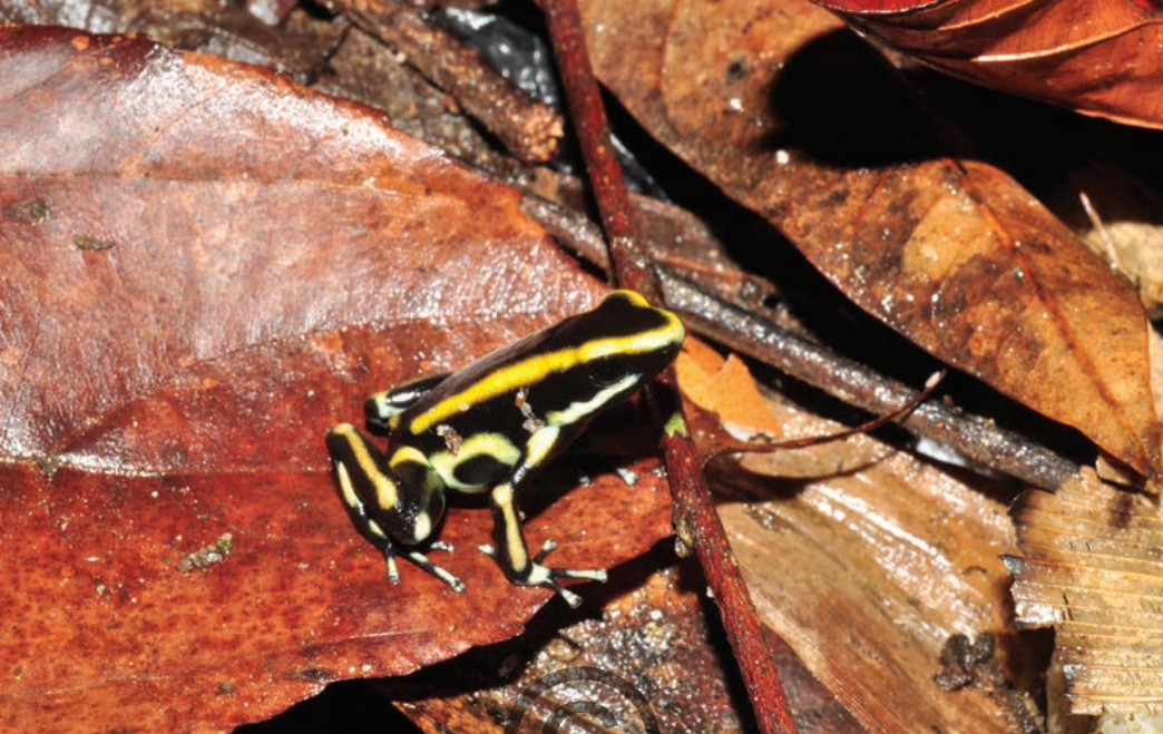
Nombre común: Rana venenosa Nombre científico: Dendrobates truncatus

Esta pequeña rana se diferencia fácilmente de cualquier otra especie gracias a su coloración negra con rayas amarillas en el dorso. Esta especie se especializa en comer hormigas y termitas, insectos de los cuales extrae alcaloides que luego incorpora a su piel. Esta rana no representa ningún peligro para los humanos o animales, sin embargo, después de su manipulación se debe lavar muy bien las manos. Esta especie fue vista en Puerto Libertador y en San Onofre.