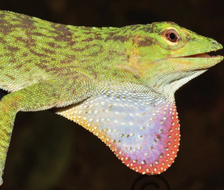
Nombre común: Lagartija, abaniquillo, lobito Nombre científico: Anolis biporcatus

Esta especie de lagartija se diferencia de otras similares por su gran tamaño, color verde y abanico en la garganta, en machos de color fucsia, morado y blanco en machos, las hembras poseen una gula pequeña de color blanco. Se presume que esta especie caza insectos de mayor tamaño, como polillas y escarabajos, lo que lo convierte en un controlador de especies nocivas para las plantas. Esta especie solo fue encontrada en el municipio de en San Onofre.