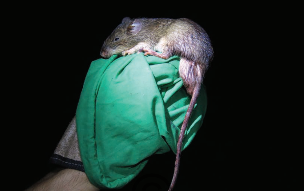
Nombre común: Ratón mochilero Nombre científico: Heteromys anomalus

Es un ratón de tamaño promedio. Su pelaje es café grisáceo en el dorso y blanco en el vientre. Sus pelos son gruesos. Esta especie posee unas bolsas en las mejillas llamadas abazones, donde pueden almacenar alimento, como semillas y otro material vegetal. El escroto (donde se ubican los testículos) en los machos es alargado y se ubica bajo la base de la cola. Es terrestre, solitario y nocturno. Se alimenta de frutos, semillas y hongos. Se encuentra en las regiones de Puerto Libertador y San Onofre.