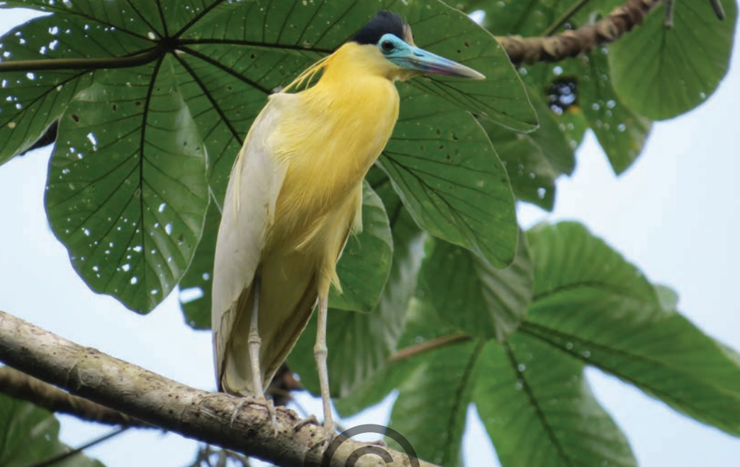
Nombre común: Garza crestada Nombre científico: Pilherodius pileatus

Es una garza de aspecto distintivo, blanca con una gorra negra y la piel alrededor de los ojos y el pico azul claro, las plumas del cuello suelen ser de color blanco amarillento o crema. Habita pantanos boscosos y manglares, generalmente en ambientes acuáticos. Captura sus presas mientras espera o camina despacio en la búsqueda de peces pequeños, ranas, renacuajos e insectos acuáticos; puede verse alimentando casi siempre solo, se une a grupos de otras garzas. Está presente en la zona de Puerto Libertador.